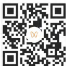
自信、自立、自强 2023 届高校毕业生就业典型实例