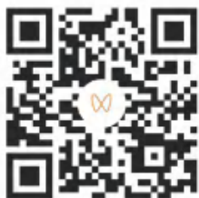
警惕就业陷阱传你 “通关秘籍”（上）