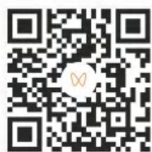
大学生职业生涯教育第一课