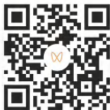
警惕就业陷阱传你 “通关秘籍”（下）