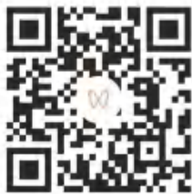
大学生求职心理调适

对于自己向往的行业和单位, 要通过上网查询、实地考察、工作实习等各种方式进行重点了解, 对于社会上各种招聘会也要积极关注, 有些单位只在该单位网站上发布招聘信