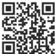
河南省教育考试院

具体报考流程可登录河南省教育考试院 ( https://www.haeea.cn ) 查阅。