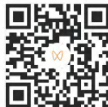
大学生的暑期经历